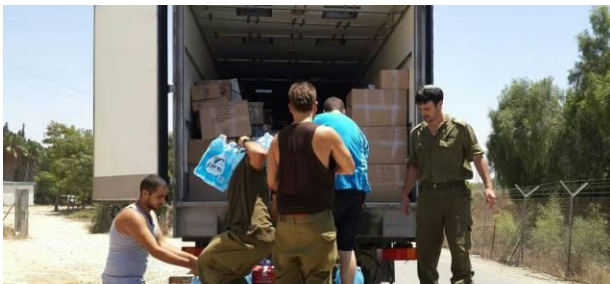
נוער קבוצת יבנה מחליט – ועושה!

הכותב הוא חבר קיבוץ ראש צורים, ראש מטה חטיבת הנגל