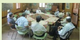
מפגש עם הרב ויטמן