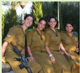
שיא במספר החניכות