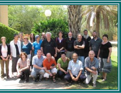
החברים מצביעים ברגליים