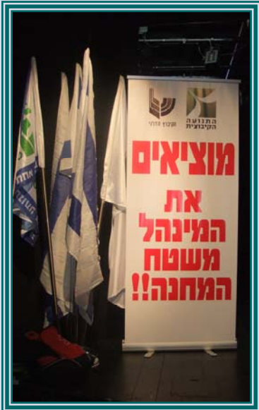
מאות נענו לקריאה

עשרות שמיניסטים ירושלמים באו למפגש הראשון של "הגרעין הירושלמי". קשה להעריך כעת להיכן יתגלגלו הדברים מבחינה מעשית, אך גם אנחנו נדבקנו בהתלהבות וברצון ליצור מחדש את המסגרת שמשלבת חיי קיבוץ עם שירות צבאי. ליסודות המוכרים שהרכיבו לפני שנות דור את מסלול הנח"ל התוסף בשנים האחרונות יסוד מרכזי: לימוד תורה, ואנחנו מחפשים את הדרך בה נוכל לשלב בתוכנית את שלושת העמודים עליהם העולם עומד: "על התורה, ועל העבודה, ועל גמילות חסדים".