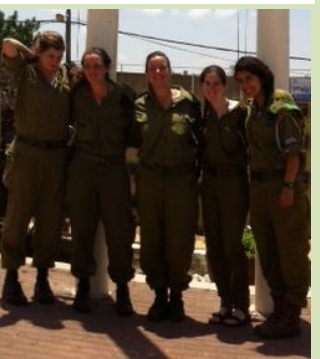
הערכה גדולה לבנות הקיבוץ הדתי ובגרות מדרשת עין הנצי"ב