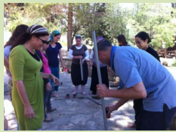
בשונה מבסדר- הפעם חוו המשתתפים סדנה שהוציאה אותם לטבע