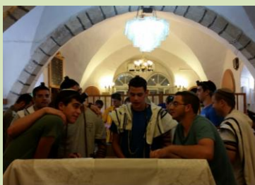
תלמידי י"ב עצרו את המסע לתפילת שחרית בבית כנסת עתיק במוצא