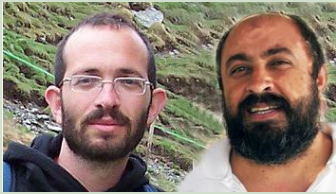
לכוון הלכה רלוונטית?

ברכות לבי"ס שק"ד עם קבלת ההודעה על זכייתו בפרס החינוך הדתי לשנת הלימודים תשע"ב. באחד מסעיפי ההמלצה שכתב מפקח בית הספר לוועדת הפרס נכתב כך: "מעטים בתי הספר הדבקים בערך ישוב ארץ ישראל באמצעות עבודת האדמה וקיום המצוות הכרוכות בחקלאות מעשית – כערך דתי! בשק"ד משולבת הזהות הדתית-ציונית-חקלאית הן במקצועות הלימוד והן בעשייה הלא-פורמאלית כחלק בלתי נפרד מחיי בית הספר, זאת במקביל לחינוך לתרומה לחברה הבא לידי ביטוי בין השאר במקום ראשון בארץ בגיוס לשירות משמעותי וערכי בצה"ל". לכל משפחת שק"ד – יישר כח גדול!