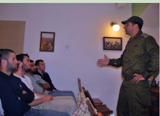
יכולנו לשבת עד הבוקר