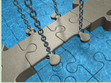
גישור – כל הקודם זוכה

הביקור של חברי המזכירות הפעילה בקיבוץ לביא החל בשעה 09.30 ונמשך עד 19.30. לאורך כל היום זכינו לקבלת פנים חמה ולבבית, ע"י עשרות חברים שהפסיקו את שגרת עבודתם ויומם כדי לשוחח עמנו על מה שקיים ועל מה שהיו רוצים שיהיה. החברים שבאו למפגשים שוחחו עמנו בחופשיות על מיגוון נושאים פנים-קיבוציים וכלל-תנועתיים, וביטאו את רחשי ליבם. משמח היה לשמוע שהקיבוץ נמצא בעיצומו של תהליך פנימי מבורך, 'מלב אל לב', המוביל את החברים לביורור ערכי ובמקביל מקדם את השיח בסוגיות המעשיות והיומיומיות. המזכירות הפעילה התרשמה מאוד הן מההתנהלות המשקית של קיבוץ לביא, ממגוון הענפים המנוהלים בצורה מקצועית, מחושבת וצעירה, והתוצאות הכלכליות בהתאם, והן מן הצד החברתי: מצאנו חברה פתוחה, טובה, בריאה וחסונה. תודה רבה למארחים!