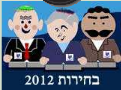
איר מאחדים את המגזר?