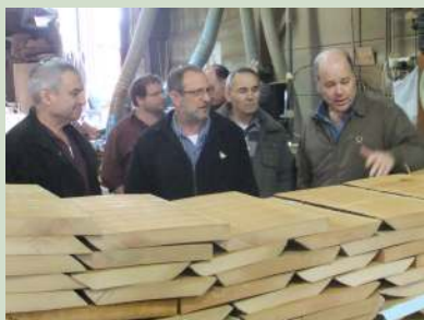
ניהול מקצועי ומחושב