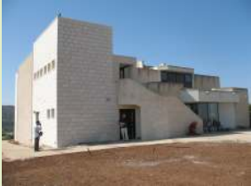
המלאכה הושלמה בזמן