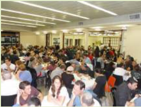
הפגנת אהבה אדירה

מאות הורים ומורים, בוגרים ותלמידים, שותפים ואוהדים, שהגיעו מהקיבוץ ומהמושב, מהעיר ומהכפר, נענו לקריאת הצוות המוביל את ביה"ס העל-יסודי בקבוצת יבנה, והתכנסו ב"חדר אוכל תיכון" שבקיבוץ לדיון בהצעות השינוי שהכין צוות ההיגוי. האולם היה צר מהכיל את כל המבקשים לשמוע את ההסברים, והזמן היה קצר מכדי לתת רשות דיבור לכל אחד מהמבקשים להביע ברמקול את דעתו. אין אומדן רשמי של מספר המשתתפים, אך יש מסקנה ברורה: היתה זו הפגנה אדירה של אהבה לבית הספר, והערכה עצומה לעשייתו החינוכית-לימודית-חברתית לאורך שנים.