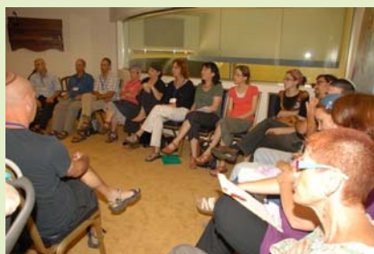
המסר - כבוד כל אדם