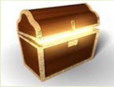
להאזין לשיעורים כשנוח

כחלק מתהליך הבינוי הקהילתי המתקיים בכפר עציון, התקיימה שבת קליטה בהשתתפות 30 משפחות שמתעתדות לאכלס את השכונה בקיץ הקרוב. יחד איתן יש עוד 17 משפחות תושבים שכבר גרות בכפר עציון, ובנות גם הן את ביתן בשכונה. בית הכנסת שהיה מלא מפה לפה בתפילת קבלת שבת, הבהיר לכל חברי כפר עציון שאכן מדובר בתהליך דרמטי ומשמעותי. ארגון מופתי של השבת ע"י צוות מעורב של תושבים וחברים, הפך את השבת לחוויה משמעותית לקולטים ולנקלטים. לפי מבול התודות שהגיעו לכפר עציון ביום ראשון, בטלפון ובדוא"ל, אכן היתה זו שבת מרוממת ומשמעותית.