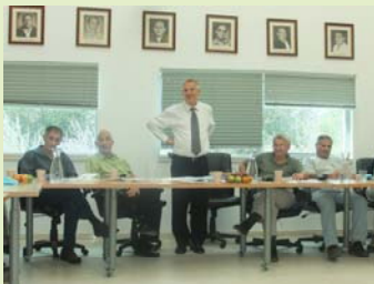
נושאים שוטפים חשובים ומעניינים