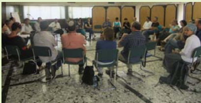
27 חברים מ-14 קיבוצים

11 רכזי תרבות של התנועה נפגשו השבוע במרכז תרבות ורוח "המקום" שבתל אביב, בו מתקיים מגוון רחב של פעילויות ואירועים שמטרתם לעודד שינוי חברתי-ערכי והתחדשות תרבותית יהודית-ישראלית. במהלך הישיבה התקיים דיון על תוכנית אירועי התרבות, בהיבט התנועתי, והתקבלה הסכמה על הצורך בהעברת מידע ובחיזוק הקשר בין הרכזים דרך מפגשים משמעותיים על בסיס קבוע. כמו כן הוצגו פעילויות תנועתיות שונות, כגון "קפה תנועה", ביקורים בקיבוצים המתוכננות לתקופה הקרובה, והוסכם על המשך קיומן של תוכניות 'קפה תנועה'. בסיום הפגישה התקבל דיווח על התוכנית לקיים בקיבוץ לביא בחודש אלול תשע"א את 'כנס המטה השיתופי'. נראה שהמפגש תרם לחיזוק וגיבוש רכזי התרבות.