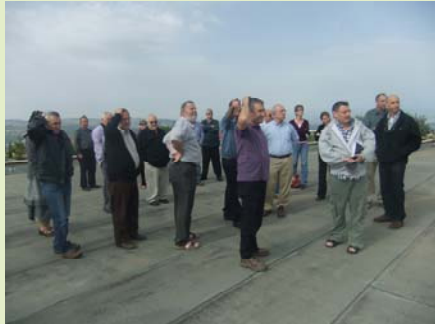
האי - רוח הנהדר...