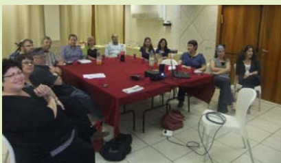
ההחלטה - חיזוק הקשר