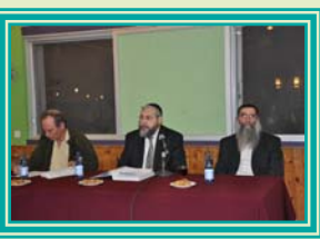
הקלה או החמרה?