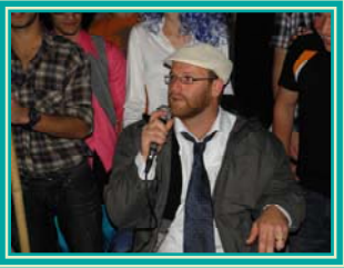
ביקור המזכירים בעלומים