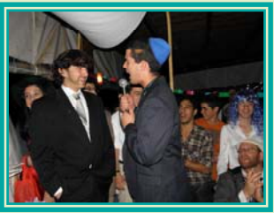
הרב שוב אחר...