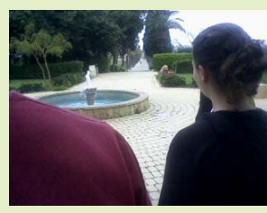
קריאה- להתעניין ולדעת!