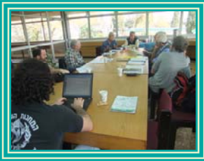
זמן לשילוב כוחות

בשבת האחרונה, ערב פורים, התפרסמה מפה לאוזן השמועה שמחבלים הגיעו עד לגדר של קיבוץ עלומים, ושם חיסל אותם כוח של צה"ל. הדברים היו קצת אחרת: בפועל, הגדר המדוברת היא "גדר המערכת", המרוחקת מהקיבוץ כ-3.5 ק"מ, ורק עד אליה הגיעו המחבלים. עם זאת, מערכת "צבע אדום" היתה עסוקה מאד בימים האחרונים במתן התראות, ובליל פורים נפל קאסם ליד המטע, קרוב לגדר הישוב.