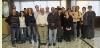
מסיבת פרידה 2