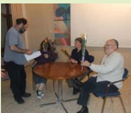
מסיבת פרידה 1