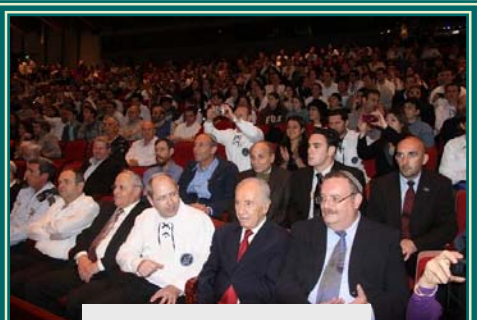
רעות ושותפות בערכים