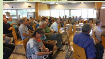
מהלך הרסני לענף שיביא לחסכון חודשי של 4-6 ₪ למשפחה!