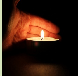
כשאפלה לכם, עתיד להאיר לכם אור עולם

השבוע קיימנו יום ההערכות ראשון של המזכירות הפעילה במסגרת ההכנות לבניית תכנית עבודה לשנת תשע"ז. ברמה הפנים אירגונית אנו מכינים לכל פעיל הגדרת תפקיד מעודכנת, תכנית עבודה שנתית כוללת (מטרות, יעדים ומדדים, נגזרות לו"ז ותקציב), סל שירותים ותכנית עבודה מול הקיבוצים. אנו מתכוונים להשלים תכנית אסטרטגית לתנועה עד סוף השנה האזרחית. בינתיים הגדרנו מספר תחומים וכיווני פעולה אסטרטגיים ראשוניים: צמיחה דמוגרפית משמעותית בקיבוצים ובתנועה; חזרה משמעותית לזירת ההתיישבות; בניית כלים לפעילות תנועתית רלוונטית במרחב העירוני וקהילתי מחוץ לקיבוצים, וקידום רעיונות וערכי תורה ועבודה; קידום פעולות משימתיות ומעורבות חברתית בכל הקיבוצים; קידום ופיתוח מוסדות החינוך התנועתיים והארגוניים החברתיים שלנו, שיפור ודיוק השירות התנועתי ליישובים; בניית מקורות כלכליים מותאמים. על השלבים, הלו"ז ושיתוף הציבור בתהליך נדווח בהמשך.