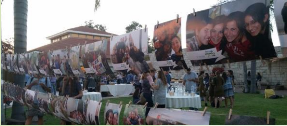
הוקרה למיילדי ומובילי החזון, הרעיון, המפעל והמעשה החינוכי!