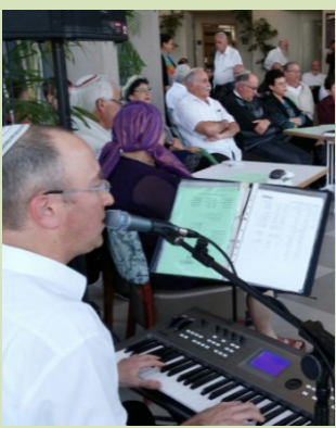
בשבת הובעה משאלה שהשבתות לא תחדלנה