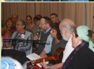
משתתפים רבים שמעידים על העניין וחשיבות הסוגיות