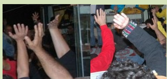
שני המועמדים החדשים יובאו לאישור המזמו"ר ביום רביעי