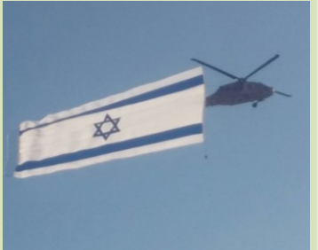
מצטרפים לברכות, גאים בבנים ומאחלים להם הצלחה בדרכם החדשה