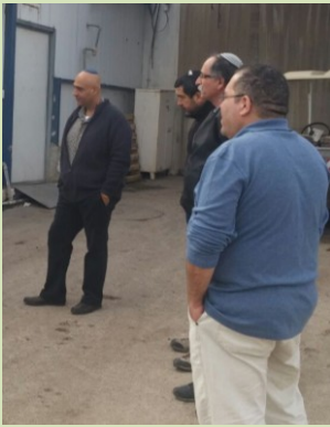
המזכירים שמעו איך התפתחו התמרים לענף מרכזי בט"צ