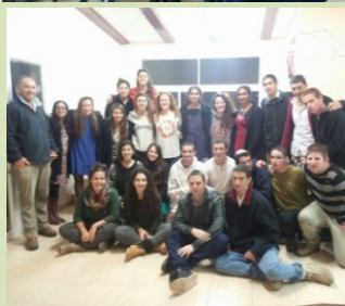
מפגש אחרון של השכבה לפני יציאתם לחיים הבוגרים