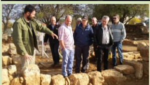
לאחר הצבת נושאים שעל סדר היום העמקנו באתגרים