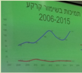
מה לעשות בשטחים החקלאיים כדי למנוע סחף ואיבוד קרקע