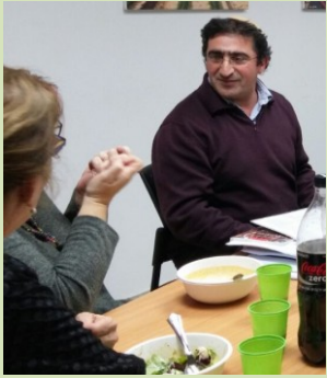
הדיון הסוער בחצות הלילה היה מעניין, מאתגר ואפילו מרגש