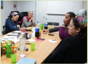
קלטנו (!) והפנמנו שכל קיבוץ צריך צמיחה והתפתחות