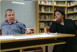
משתתפים באים בקביעות ומצביעים ברגליים על האיכות