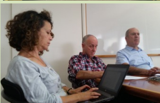
עדכון תכנית המתאר הארצית העוסקת במרחב הכפרי