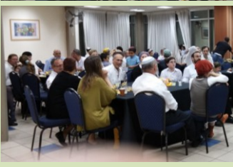
שבת של דיבוק חברים, למידת עמיתים ושיחות אל תוך הלילה