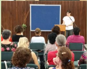
הכוונה לא רק לדבר על שיתופי פעולה אלא לקיימם בשטח