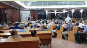
מעגלי לימוד ברוב עם ובאווירה ייחודית ומרוממת