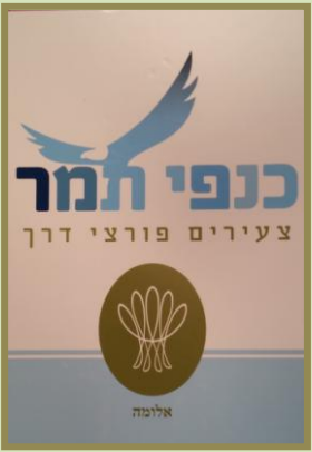
לשתף בדרכה של תמר: ציונות, אהבת הארץ ותרומה

כפר הנוער נווה עמיאל זכה השבוע להכניס ספר תורה חדש לבית הכנסת המקומי. שלושה אחים שכתבו ספר תורה לזכר הוריהם, חיפשו עם השלמתו, באמצעות הפייסבוק, קהילה הזקוקה לספר. ערנות הנהלת הכפר הביאה ליצירת קשר עם בני המשפחה, והם הזדרזו לבוא ולהתרשם מהכפר ומעשייתו החינוכית. לאחר הביקור החליטו האחים שהמקום ראוי להנצחת יקיריהם לאור העבודה החינוכית הנפלאה הנעשית בו, והשבוע – לאחר שהמכובדים ונציגי הילדים סיימו לכתוב את האותיות האחרונות – ליוו חניכי הכפר את המתנה היקרה והקדושה בשירים וריקודים מבית הכנסת במושב שדה יעקב אל ביתם הסמוך.