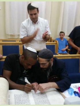
האחים החליטו שכפר הנוער ראוי להנצחת יקיריהם