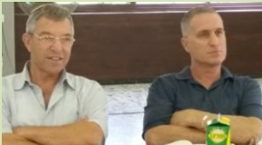
כולנו תקווה שיעלה בידינו להגשים את כל תכניותינו