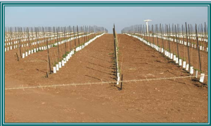
לחיי נטיעות חדשות בקהילה