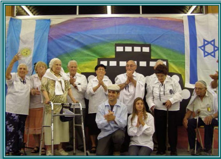
שחזור חווית העלייה

השבוע התקיים מפגש מיוחד של 14 חברי גרעין הכשרה של בני עקיבא מארגנטינה ואורוגוואי, אשר עלו לארץ באנייה מיוחדת מארגנטינה לישראל לפני בדיוק 60 שנה. בקיבוץ סעד, אליו הגיעו העולים הצעירים ישר מהאנייה, העלו חברי הגרעין (שהיום הם בני 80) הצגה מרגשת, שהיא בעצם שחזור חווית העלייה שלהם. בחולצות בני עקיבא עם סמל מיוחד שעיצבה ברכה, חברת הגרעין, עלו ושרו חברי גרעין את המנון הקבוצה. זאב שוורץ, מזכ"ל בני עקיבא העולמית, אמר לחברי הגרעין ומשפחותיהם: "בזכותכם בני עקיבא היא תנועת הנוער הציונית הגדולה בעולם. אתם בניתם את מדינת ישראל, ובזכותכם אנו נמצאים כאן היום".