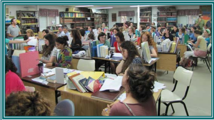
ממשיכים ללמוד ולזכור