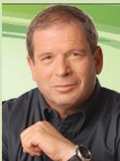
תומכים בעמדת חקלאי ישראל: כל רפורמה רק בהדברות עם החקלאים