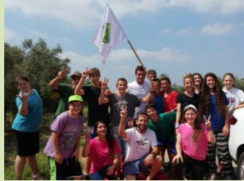
רוח ספורטיבית של ילדי ז' במירוץ - 'טבילת אש' ראשונה לתוך התנועה