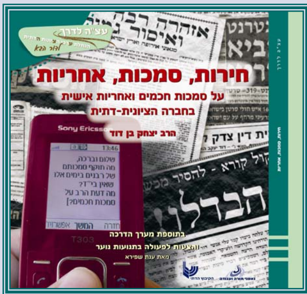
שיקול דעת או כח ההוראה?