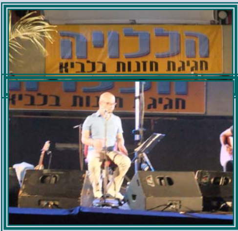
על הדשא - לכל דכפין

השבוע נערכת בלביא, בפעם ה-13, "הללויה" - חגיגת חזנות ומקהלות חזנים". בנוסף לסדנאות, הרצאות וכיתות אמן שהתקיימו לאורך כל השבוע, נערכים במתכונת השנים הקודמות שני מופעים גדולים על הדשא, פתוחים לכל דכפין: ביום רביעי הופיע קובי אוז ב"מזמורי נבוכים", ולמחרת מתוכנן קונצרט חזנות חגיגי, בהשתתפות אמנים רבים וטובים.