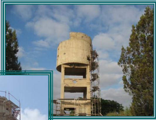
החלו עבודות השימור