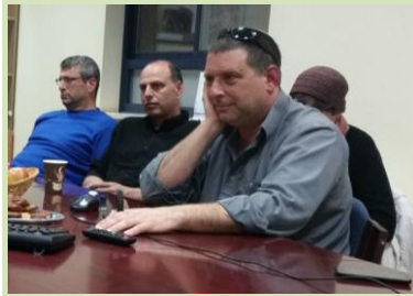
לאחר פרויקט שיכון מרשים ולקראת תקופה של התמודדות עם אתגרים