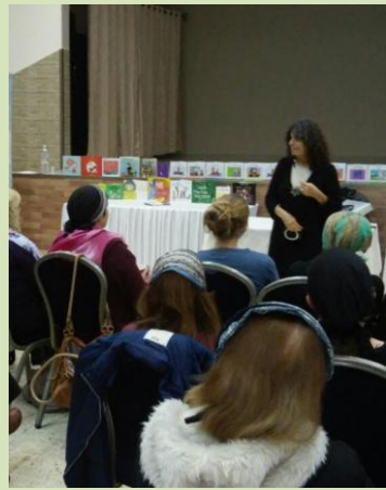
דובר על חשיבותן של האותנטיות ותודעת הלב בתהליך החינוך