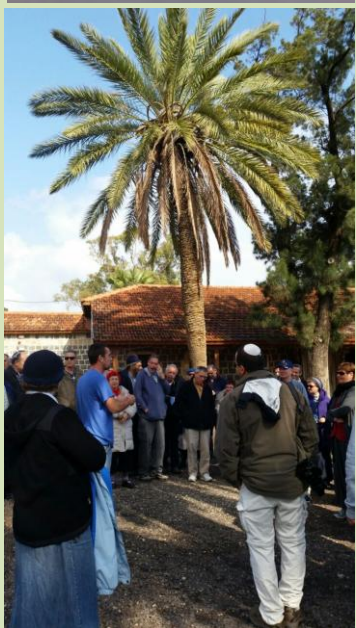
שלושה ימים קסומים השאירו טעם של עוד וכמיהה לשמיטה הבאה...