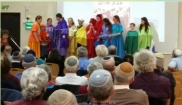
לצד הצבעוניות של ילדי עלומים סיפרו רכזי צחי על חיי היומיום בצל הנפילות

ביום שלישי הבעל"ט יתקיים בעז"ה יום עיון בבארות יצחק לגננות ומובילות במערכות הגיל הרך, ושבוע לאחר מכן, ביום שני, יתקיים יום עיון דומה בשדה אליהו. פרטים אצל נירית אפרתי ורכזי החינוך! מומלץ!