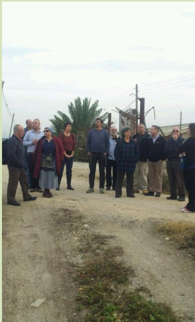
הערכה למנהיגות איתנה ויציבה הבולטת ביכולותיה בתקופה מאתגרת זו