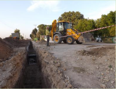
תחילת עבודות התשתית להקמת בית מדרש של קבע במדרשת עין הנצי"ב

לימדת פרק בהלכות חיים כיבוד הורים כיבוד הזולת ואהבת חסד