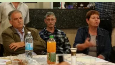
ההצעה מונחת על שולחנה של אסיפת חברים – קליטת בנים חילוניים כחברי קיבוץ