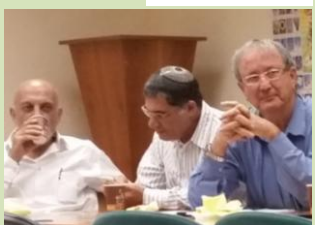
בסוף גובשה טיוטת 'חזון התאחדות חקלאי ישראל'