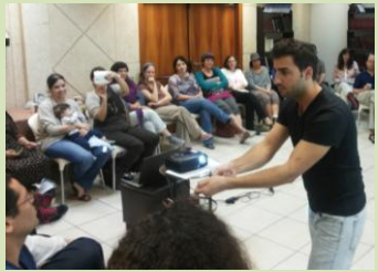
רבים מהם נרתמו לתפקיד מתוך תחושת אחריות ושליחות