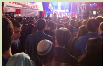
המכנה המשותף הוא השאיפה לקיים חברה סובלנית ומאוחדת