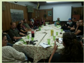
יש תחושה כי אכן הרוח נושבת במפרשים, וכי הסירה לא טובעת