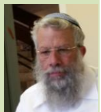
הכדור עבר לידי מקבלי ההחלטות. אנחנו נשארים עם התקווה ונכונים למשימה