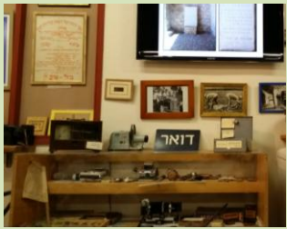
המזכ"פ זכתה לראות ולשמוע על עשייה ברוכה, גדולה ומגוונת