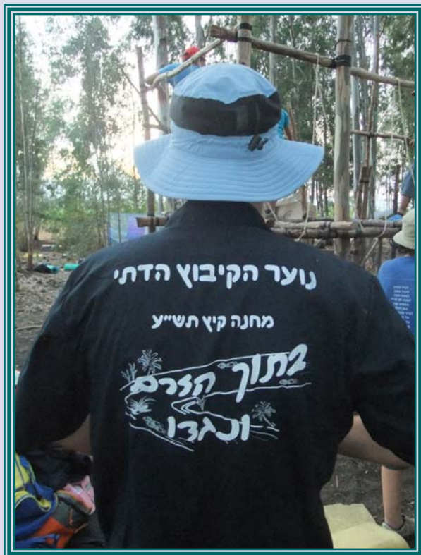
חולצת עבודה 2010