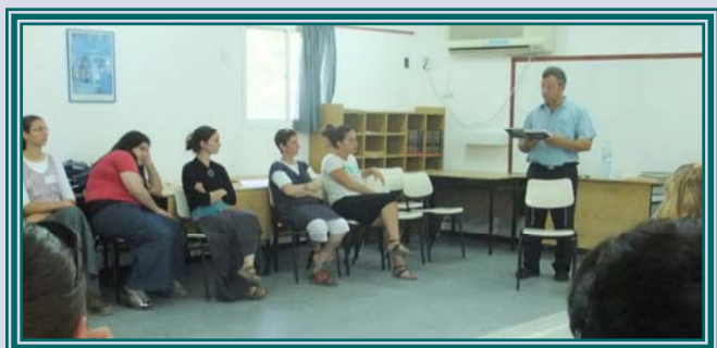
הווי מיוחד של הקיבוץ