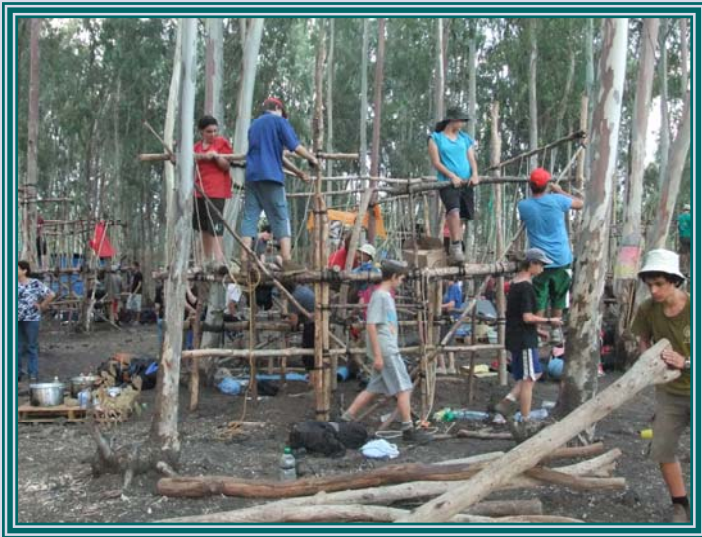
הפנמת ערכים תוך עשייה