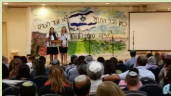
סוף שנה עם דיווח מרגש מימין אורד. אחוז ניכר יגיעו לשירות צבאי