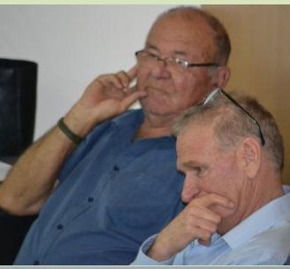
כנס החטיבה להתיישבות השתלבות המרחב הכפרי בסדר היום הלאומי על רקע מצוקת הדיור והמחאה החברתית