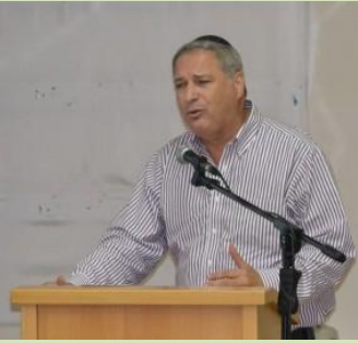
יצירת 5,000 דירות במרחב הכפרי תתרום לחיזוק קיבוצים ומושבים