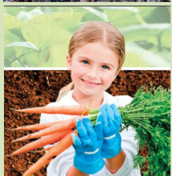
השבת se הארץ