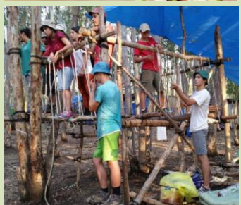
נוער הקיבוץ הדתי- מחכה לכולנו קיץ חם, פעיל, מרענן ומהנה