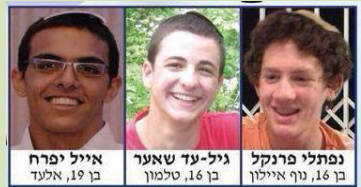
לעצרת התפילה חשיבות רבה יחד עם שיחה ואיזון הדברים בפני הנוער