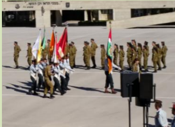
ראינו, שמענו, התרגשנו וחווינו הרבה גאווה על יציע ההורים והמשפחות