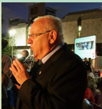
לומדים ומשוחחים בשקט על המדינה האהובה שלנו, על העם הנפלא

לאחר עבודת מטה רבה של הצוות הבין-תנועתי העוסק בנושא ואנשי המקצוע המלווים אותו, עלו השבוע על שולחנה של מועצת מקרקעי ישראל שתי הצעות החלטה שמטרתן להסדיר את שאלת הבנייה למגורים בקיבוצים. הראשונה, "חלופת האגודה", מאפשרת לקיבוץ לרכוש במרוכז מרשות מקרקעי ישראל את כל זכויות הבניה, ולהקצות אותן אחר כך לחבריו, בתנאים שיסוכמו ביניהם, ללא צורך בחתימת המינהל על כל היתר בניה. השנייה, "מסלול הפיקדון", הינו מסלול שיאפשר המשך בנייה סדירה בקיבוצים שלא רוצים או לא יכולים לשלם את העלות של היוון כל זכויות הבניה. בחלופה הזו, רשאי הקיבוץ לדרוש מכל מצטרף להכניס הון לאגודה (או להפקיד סכום מוסכם), דבר אשר יקל על האגודה לממן בניית דירה בעבורו. במקרה של עזיבה, יוכל החבר לקבל חזרה את ההון שהפקיד באגודה, אך לא תהיה לו זיקה כלשהי לדירה שנבנתה עבורו ע"י הקיבוץ. לכל אחת משתי ההצעות יש יתרונות וחסרונות, וכל קיבוץ יהיה רשאי להחליט במה הוא בוחר. בבסיסן של שתי ההצעות עומד העיקרון כי הקיבוץ יישאר בעל יכולת לממש צורת חיים קהילתית ייחודית ולאפשר המשך קליטה גידול וצמיחה. בעקבות בקשתו של היועץ המשפטי לממשלה, לבחון את הסוגיה בטרם הצבעה, הוחלט על ידי מנכ"ל משרד השיכון ומנכ"ל רשות מקרקעי ישראל לדחות את הדיון וההחלטה בנושא לישיבת המועצה הבאה. חשוב לומר: עצם הבאתן של הצעות ההסדר בצורה מתואמת הינה שלב משמעותי ביותר בהסדרת מערכת היחסים בין רשות מקרקעי ישראל לבין הקיבוצים.