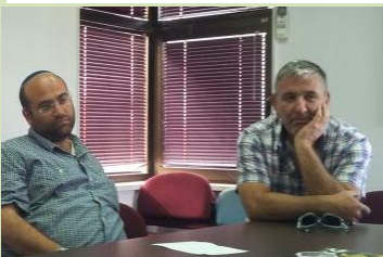
ראשי המוא"ז והארגון המפעיל של הגיל הרך