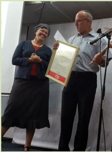
המטרה – קידום השיווק באמצעי המדיה הדיגיטלית במגזר הדתי

במעגלים הולכים ומתרחבים אנחנו מפיצים את יוזמתנו לעריכת "כנס השמיטה של ההתיישבות העובדת", שיתקיים בעז"ה ב- י"ט בתמוז (17 ביולי 2014), בקיבוץ גן שמואל. סיבות רבות חִבְרו לכך שההערכות לקראת שנת השמיטה הבעל"ט שֹׁנָה במהותה מזו שקדמה לשמיטות בעבר, ולטובה! בכוונתנו לכנס באולם הגדול שבקיבוץ גן-שמואל מאות חברים וצעירים מהקיבוצים והמושבים, דתיים וחילוניים, חקלאים, מחנכים ובעלי תפקידים במזכירות, להביא בפניהם את דבר השמיטה בצדדיה ההלכתיים והמחשבתיים, ולגרום לכך שכולם יתחילו "לחשוב שמיטה".