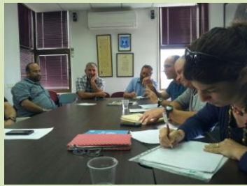
כולם יצאו בתחושה טובה ובהבנת חשיבות המשך שיתוף הפעולה