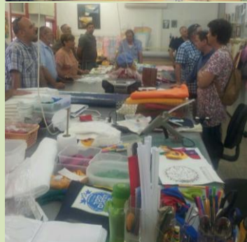
המזכירים עמדו על ערך התעסוקה למבוגרים בקהילה הקיבוצית