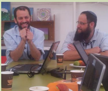
לאור הצלחת תכנית יג"ל רואים בהתרחבות המסלול יעד ריאלי