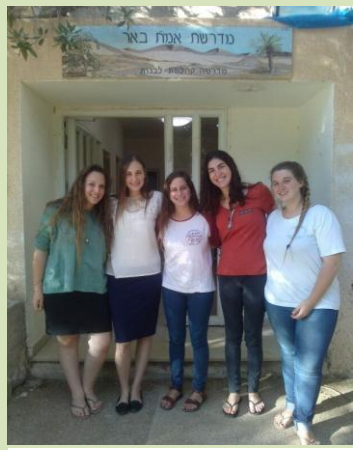
המטרה - קשר עם כלל בנינו ובנותינו הפרוסים על פני הארץ כולה