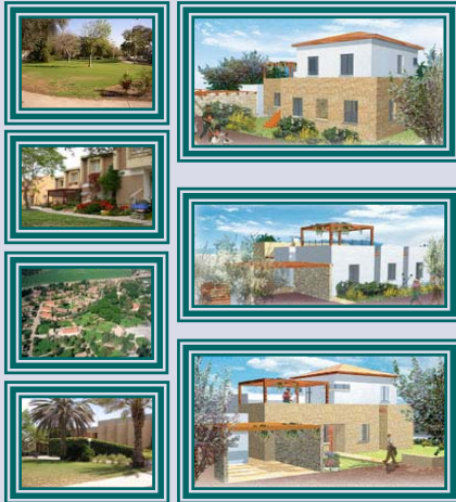
תהליכים מורכבים תוך שיתוף פעולה

ביום שני ביקרו חברי המזכירות הפעילה בקיבוץ סעד, במסגרת מפגשי 'מטה מול מטה' הנערכים בכל קיבוצי התנועה. בתחילת הביקור נפגשו עם חברי ההנהלות השונות, עם רכזי הענפים הכלכליים ורכזי הפעילויות החברתיות. לאחר מכן התפצלנו לקבוצות דיון עם חברי קיבוץ סעד – עם הותיקים, עם גיל הביניים ועם הצעירים. ההשתתפות היתה מכובדת מאוד. בסוף היום התקיים מפגש מסכם עם נציגי ההנהלות לליבון הנושאים שעלו במהלך הביקור. חברי מזכירות הפעילה שמחו לפגוש הנהגה המובילה תהליכים מורכבים, תוך שיתוף פעולה מרבי עם כלל ציבור החברים. ננצל את הזדמנות לומר לאנשי סעד תודה על האירוח הנפלא!