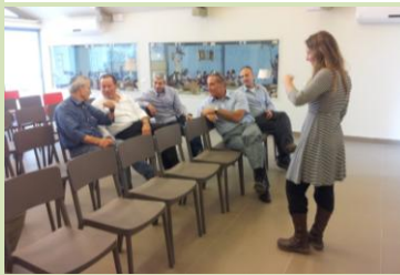
יצאנו בתחושה שבביקור הזה נזרעו זרעים שיניבו בקרוב פירות מתוקים