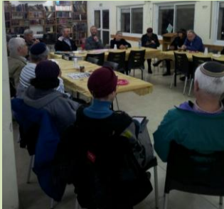
עצרו משגרת יומם והקדישו יום לציסוק בשאלות ערכיות

למעלה מ- 300 גנני נוי מהעיר ומהכפר הגיעו לגבעת ושינגטון, לכנס ארצי שנערך ביוזמת המשרד לשירותי דת, וכותרתו: היערכות גן הנוי לשנת השמיטה . את יום העיון פתח הרב הראשי לישראל, הרב דוד לאו שליט"א , ולאחריו נשאו דברי ברכה: הרב אלי בן דהן, סגן השר במשרד לשירותי דת, ומר אלחנן גלט, מנכ"ל המשרד. את ההרצאה המרכזית נתן הרב יעקב אריאל שליט"א, הרב הראשי של רמת-גן המכהן כיו"ר ועדת השמיטה של הרבנות הראשית לישראל . הרב אריאל, שהתמקד במתן הנחיות הלכתיות לציבור הגננים, אמר בין השאר: "שש שנים אנו פועלים כבעלים באדמתנו ובשנה השביעית מתפנים לעיסוקים רוחניים ... וכשליחים נאמנים אנו מופקדים על שמירת הקרקע, לדאוג לנאותה ולייפותה, אך איננו נוהגים כאדונים, ולכן איננו שותלים בשנת השמיטה צמחים חדשים. היערכות נכונה השנה, בערב שנת השמיטה, תאפשר לנו קיום של צמחייה ארוכת-טווח שנתחזק אותה, במהלך שנת השמיטה כולה". לאחריו נתן מר ישראל גלון (אגרונום העובד ב'שירות הדרכה מקצועית' של ממשד החקלאות) הנחיות מקצועיות, ובסוף היום הרצתה הגב' עינת קרמר, מנהלת ארגון 'טבע עברי' , שאמרה: "בימינו, בחברה שרובה אינו חקלאי ואף אינו דתי, נשאר מעט מאוד מן העולם הרוחני והערכי של השמיטה. "שמיטה ישראלית" הינה קואליציה של ארגונים, עסקים ומוסדות, המנסה לשנות את המצב הזה, ולהחזיר בשנה הקרובה את העיסוק בשמיטה על ערכיה, למרכז הבמה של הציבוריות הישראלית".