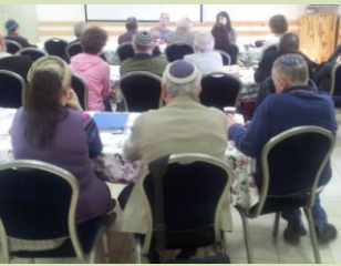
מקום שהתועלת תהיה ניכרת בעבודה מול חברת הביטוח