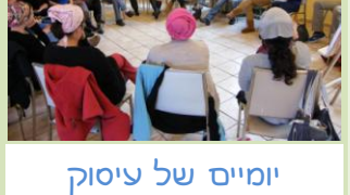
יומיים של עיסוק במתח בין הסתפקות במועט לעושר רוחני