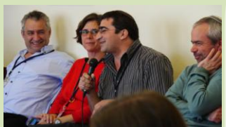
עצרו משגרת יומם והקדישו יום לעיסוק בשאלות ערכיות