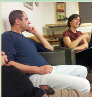
צרפנו שותפים, גייסנו משאבים, והיום פשוט הלום!

בשעת כתיבת שורות אלה עסוקים חברי המזכירות הפעילה בהכנות אחרונות ל"יום השלישי" של מועצת החינוך, שנפתחה לפני כחצי שנה בשני ימים משמעותיים בקיבוץ סעד ומסתיימת בשבוע הקרוב בעוד יום של דיונים וקבלת החלטות. תהליך גיבוש חלק מהצעות ההחלטה לא היה פשוט, ואנו צופים דיון ער בנושאים המרכזיים שעל סדר היום. בעמוד הבא מופיע לוח הזמנים של ה"יום השלישי" ואנו מקווים ומאמינים שתתקבלנה בו החלטות שיקדמו את נושא החינוך בתנועה. בעזרת השם נעשה ונצליח!