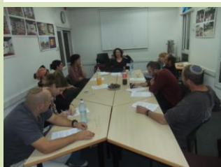
מאמינים שתקבלנה החלטות שיקדמו את נושא החינוך בתנועה