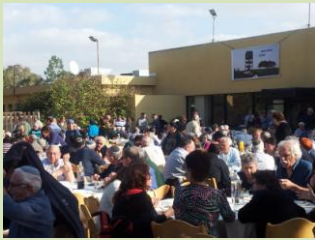
צירפנו שותפים, גייסנו משאבים, והיום פשוט חלום!

"מפגלות הציונות הדתית", ארגון גג למאות מוסדות, עמותות, ארגונים ורשתות חינוך של המיגור הציוני-דתי, כינס השבוע במלון לחוף ים המלח את ציבור המנהלים, לדיון בשורה ארוכה של נושאים המונחים על שולחנם, ובראש השורה ניצבת המצוקה התקציבית התמידית המאפיינת מוסדות חינוך. את הכנס כיבדו בנוכחותם ובדבריהם רבנים, שרים, חברי כנסת, ובעלי משרות בכירות במיגורן רחב של ענפים ומקצועות. אנחנו ניצלנו את הכנס למפגש של כל מנהלי כפרי הנוער הדתי, והרשינו לעצמנו לפרוש מהמליאה לשעה-שעתיים, ולקיים דיון פנימי בסוגיות מורכבות המעסיקות אותנו: איתור תלמידים לכפרי הנוער, שמירה על קרקעות הכפרים וניצולן למטרות חינוכיות, איוש משרות ההדרכה, החלפת צוות מורים ותיק ועוד.