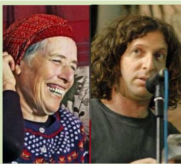
אם רק נצליח ליצור סדק שדרכו תחלחל האמונה שאפשר וצריך לחלום