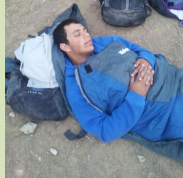
לפתח יכולת התמצאות, לחוש להרגיש ולנשום את השטח ביום ובלילה