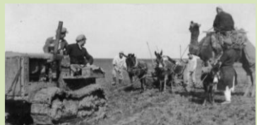
דילמות בשימור סיפורי מקום – מה לשמר ומה להרוס ולבנות מחדש?