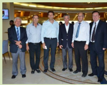
מלון ניר עציון הותאם לכנסים ואף התחדש במערכת גיאותרמית.