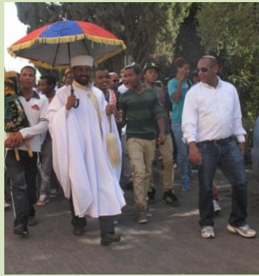
300 איש מכל רחבי הארץ הגיעו לכפר הנוער לחגוג את הסיגד

פורום מזכירים התכנס בקבוצת יבנה למפגש השני של השנה. הפורום סייר בקיבוץ ועמד על משמעותה של מורשת המקום ויושביו, והתוודע לדילמות הכרוכות בשימור סיפורי המקום ואנשיו: מה לשמר ומה להרוס ולבנות מחדש? כמה ניתן ומתאים להשקיע? למה זה חשוב? ועוד. בהמשך דנו המזכירים בשאלות של בניה קיבוצית למגורים: מהו התהליך הציבורי הנדרש? כיצד בונים את תהליך קבלת החלטות באופן המאזן בין דמוקרטיה קיבוצית ישירה לְמְשִׁילוּת, כך שניתן יהיה לנהל את הנושא, לקבל החלטות מושכלות ודמוקרטיות וגם לבצע אותן? מהם האינטרסים והערכים הפועלים בנושא כזה? כיצד מאפשרים חופש בחירה והשפעה אישית לחברים בתוך פרויקט קיבוצי-ציבורי? בדיון הודגשו מספר נקודות: פרויקט בנייה קיבוצית הוא נושא גדול, ומחייב תכנון כולל – אדריכלי, חברתי, כלכלי, ביצועי; יש לשקול יצירת מנהלת מיוחדת שמובילה את הנושא בלמידה, הכנה וניהול; הרוח והשפה החברתית עוברת שינויים; החברים מבקשים יותר מעורבות ומרחב תמרון אישי בתחום השיכון הקיבוצי ויש למצוא את ההתייחסות המתאימה לכך. ברוך ה' יש ביקוש לקליטה (לחברות או תושבות) בכל קיבוצנו, ואנו מוצאים דרכים שונות לקלוט אותם, לכן יש להתאים את מודל השיכון למודל הקליטה בכל קיבוץ.