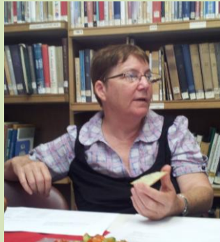
החשיפה – לחצוא תקציב שיעודד ויזרז שיפור הארכיונים