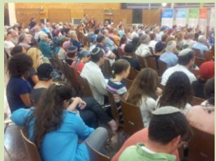
ערב משמעותי וייחודי המעורר לחשיבה ולעשייה