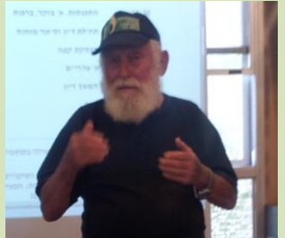
כדי שתהיה תעשיית הייטק, צריך לעבוד את האדמה