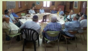
'לקיבוץ הדתי משקל רב מחספר בוחריו' ח"כ אורבך