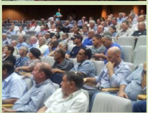
בראש המשימות - תיקון הדימוי שיש בציבור לחקלאות