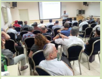
הזדמנות להוזלת חשכל וגז טבעי