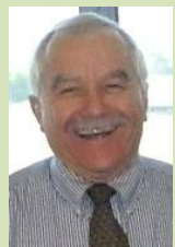
המטרה: יישור קו והעלאת הנושאים