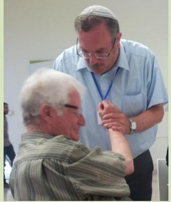
הדרך להובלת שינוי חברתי בנושאי דת, חברה ומדינה