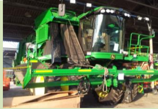
הקידמה - עובד אחד ומכונה במקום עשרות עובדים