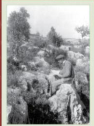
שלום קרניאל חייו ומשנתו

בערב מרגש ויוצא דופן ציינו בנות מדרשת עין הנצי"ב את סיום שנת הלימודים. הנהלת המדרשה שהתכנסה השבוע שמעה דיווח מהמנהלים על ההערכות לפתיחת שנת הלימודים תשע"ד. מספר הנרשמות הגיע לשיא של כל הזמנים, והוא עומד על 82 תלמידות מתוכן 19 בנות חו"ל, כמו כן הצוות מתחזק בעוד בוגרת מדרשה הבאה עם משפחתה לגור בעין הנצי"ב ותשמש כר"מית במדרשה. בשעה טובה חברי עין הנצי"ב אישרו ברוב גדול את הקצאת השטח הדרוש לבניית בית המדרש החדש, דבר המאפשר לנו לעבור לתכנון מפורט של הבנייה. תוכנית "היום הפתוח" עוברת שדרוג, והיא תיקרא מעתה: "מעיינות", וכבר כעת יש התעניינות רבה מצד חברי קיבוצים דתיים ושאנים דתיים המבקשים להתבסס גם מהפן הזה של "עמק המעיינות".