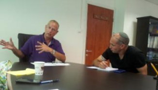
אנו מחכים בכליון עיניים לתוצאות חיוביות מהפגישה