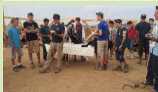
היה מרגש ומעורר השראה!