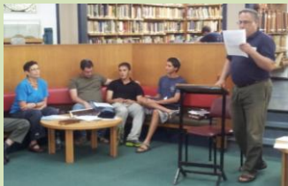
פרי מתוק ראשון שנולד במועצה