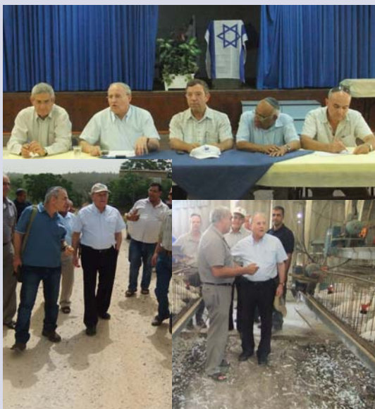
ללמוד את הדברים בשטח