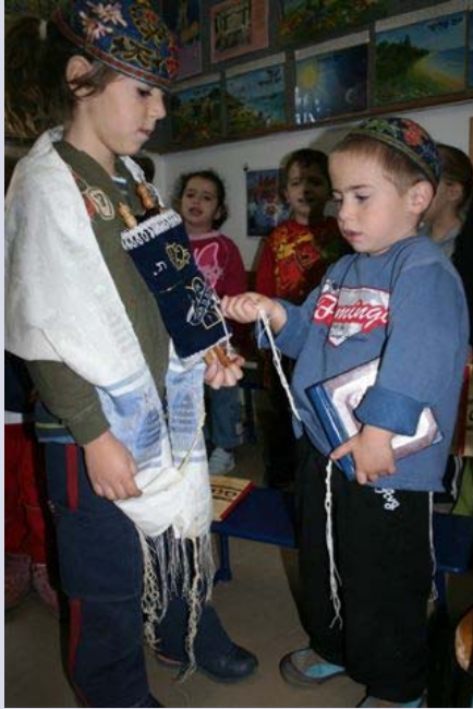
לימוד מצוות והטמעתן בגיל צעיר