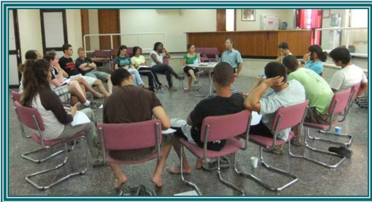
צעירים עם ברק בעיניים