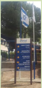
עדיאל נכנס לניהול הכפר ורוח חדשה החלה לנשׁב בעשייה