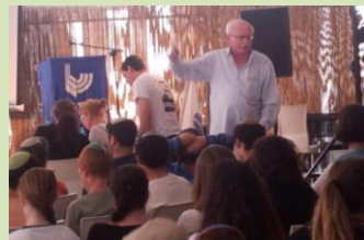
מאות משתתפים גדשו את מדשאות כפר עציון