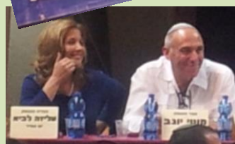
והפעם - דגש חזק על היבטים חברתיים